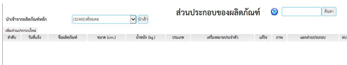
ภาพที่ 13 แสดงรายการนำเข้าสู่ผลิตผลิตภัณฑ์ประกอบ